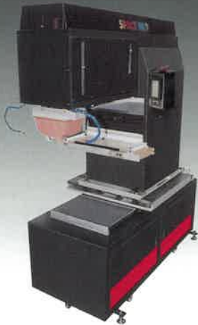
410SKP + LLD-BED